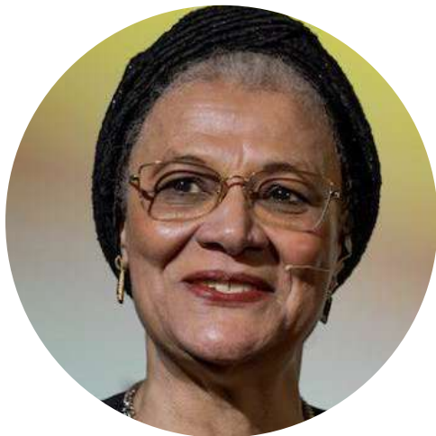
La jueza Amina Augie, del Tribunal Supremo de Justicia de Nigeria, contó su experiencia para llegar a convertirse en jueza en el evento de la Plataforma por la Justicia de Género. #HagueTalks

En 2023, la Plataforma por la justicia de género , una alianza mundial entre el PNUD y ONU Mujeres para promover la igualdad de género y cerrar la brecha de justicia en materia de género mundial, amplió su red y alcance gracias a nuevas asociaciones. Asimismo, se incrementó el apoyo a la programación a nivel nacional y 31 países recibieron ayuda a través de la Plataforma.