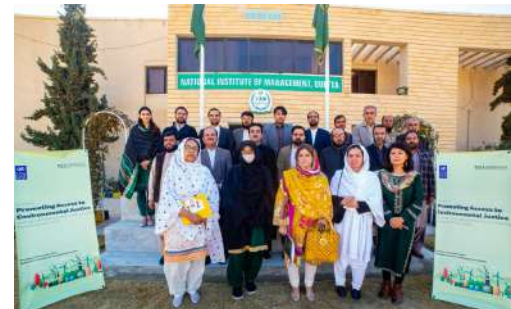
Sesión de consultas sobre la promoción del acceso a la justicia ambiental con las principales administraciones públicas en Baluchistán PNUD