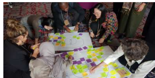
Conocimientos y Aprendizaje Colaborativos sobre Estado de Derecho, Seguridad y Derechos Humanos 2023: fomentar el cambio a través de MEL, innovación e integración. PNUD

En 2023, la unidad de MEL (co)ideó y organizó una serie de actividades de aprendizaje para estimular la reflexión colectiva, el intercambio de conocimiento y el aprendizaje.