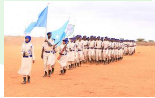
Reclutas básicos de las recién formadas fuerzas policiales de Galmudug.