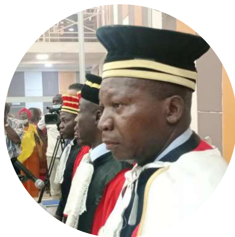
En la República Centroafricana, acabar con la impunidad es la prioridad del Programa Conjunto sobre el Estado de Derecho. PNUD República Centroafricana

Durante 2023, el GFP proporcionó financiación catalizadora y/o experiencia técnica para la elaboración de programas conjuntos sobre el Estado de derecho en la República Centroafricana, la República Democrática del Congo, Haití, Libia, Mali y Somalia