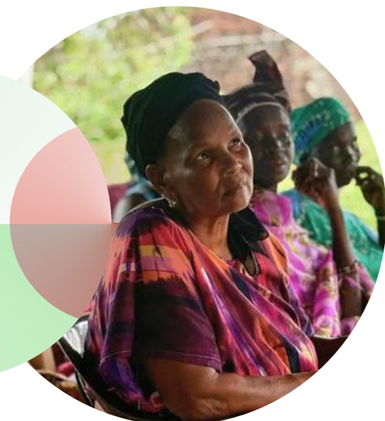
Sesión de sensibilización sobre la violencia sexual y de género en una zona rural, región de Gabu (Guinea-Bissau).

El acceso a los derechos humanos y a la justicia es fundamental en tiempos de conflicto y crisis con el fin de prevenir y abordar los crímenes de guerra, proteger a los civiles, garantizar la rendición de cuentas, amplificar los esfuerzos para mantener la paz y promover el desarrollo con posterioridad a un conflicto, incluido los esfuerzos de justicia transicional. Al mismo tiempo, las medidas de seguridad son esenciales a la hora de salvar vidas, reducir la violencia y mantener el contrato social y la cohesión.