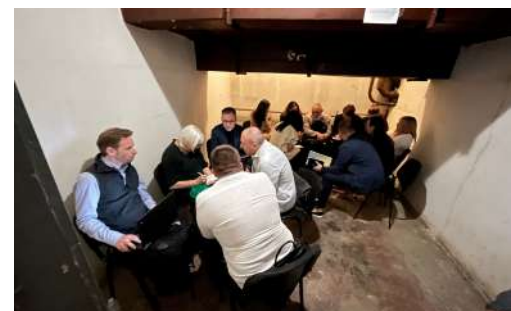
Entrevista en Kiev con la administración de la Secretaría del Comisionado para los Derechos Humanos del Parlamento ucraniano en el refugio durante la alerta aérea.