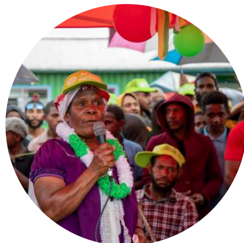
En 2023, el PNUD abrió un espacio de educación por la paz en una escuela local de Kupari, en la provincia de Hela (Papúa Nueva Guinea). En los últimos años, la provincia se había convertido en una área de conflictos entre comunidades.

De cara a la programación de SALIENT en 2024, el equipo desarrolló consultas nacionales en Ghana, Kirguistán, Panamá y Papúa Nueva Guinea con el fin de determinar las necesidades de estos países en materia de reducción de la violencia armada.